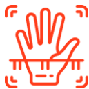
Рисунок вен ладони